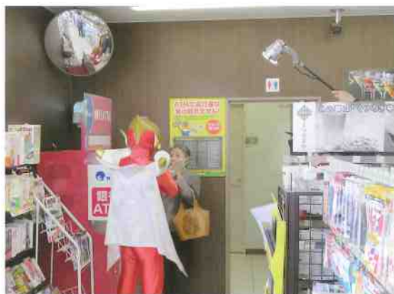
還付金等詐欺の1シーンの撮影

の二種類の防犯CMを作製いたしました。作製にあたり、女性部の役員さんの全面的な協力を得て撮影収録を行いました。編集作業も終了し、近日中に大型商業施設等で放映を開始する予定です。