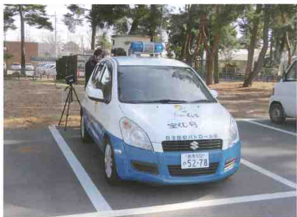
子どもの見守り活動の撮影