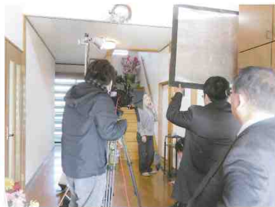
還付金等詐欺の1シーンの撮影

防犯協会では、これまで大型商業施設で放映していた広報啓発用の映像を一新するため、振り込め詐欺被害防止編 子どもの見守りパトロール編