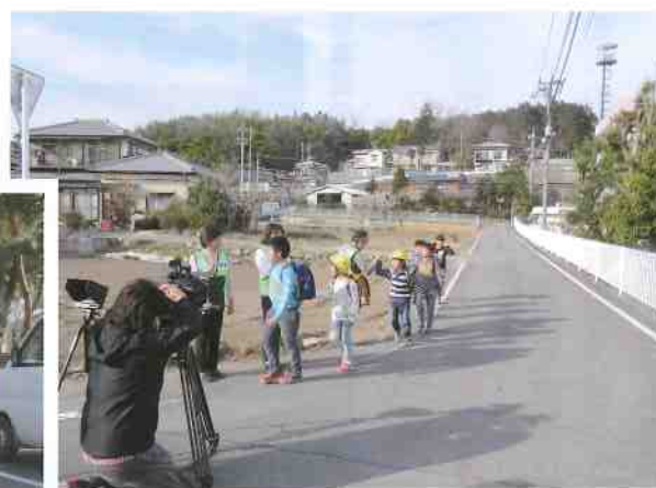
子どもの見守り活動の撮影

の二種類の防犯CMを作製いたしました。作製にあたり、女性部の役員さんの全面的な協力を得て撮影収録を行いました。編集作業も終了し、近日中に大型商業施設等で放映を開始する予定です。