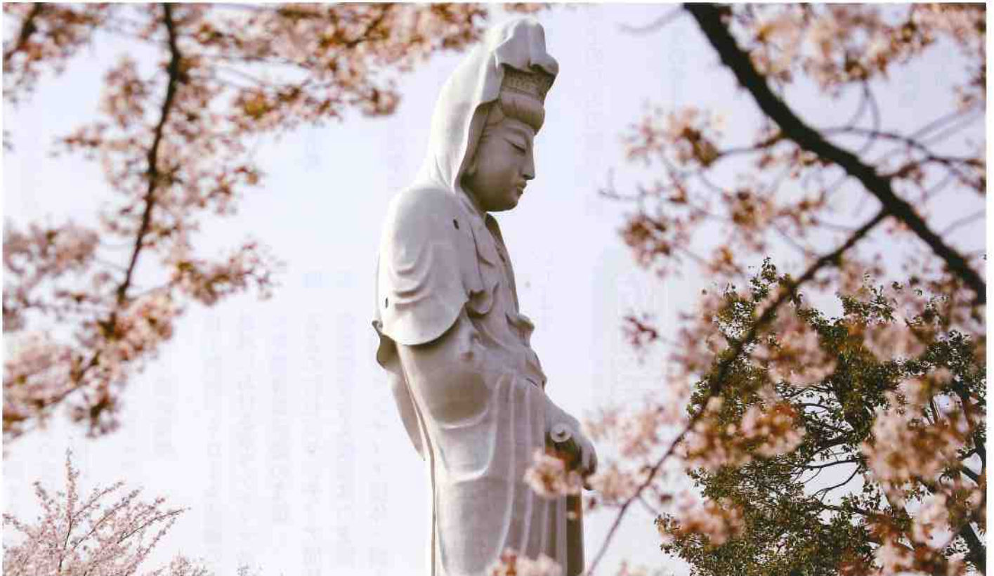
高崎市・白衣観音