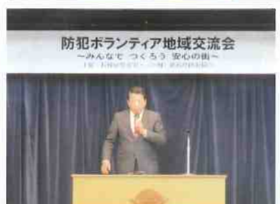
振り込め詐欺被害の防止研修