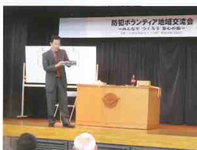
マジックショーの状況