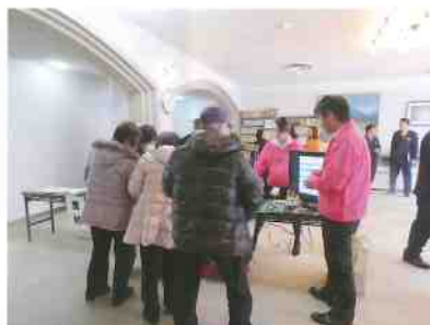
防犯グッズ展示の状況