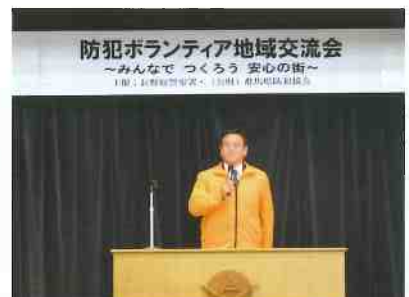
防犯協会事務局理事の挨拶