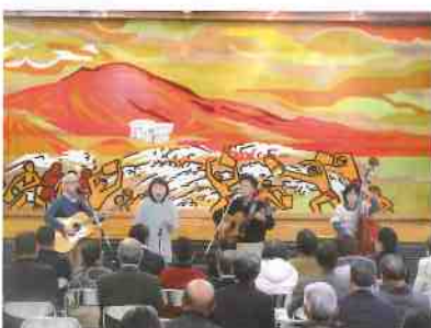
ふれあいコンサートの状況