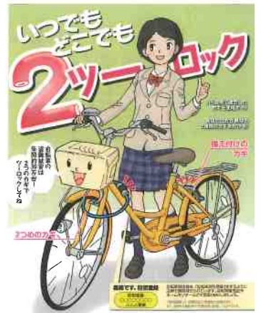
群馬県警察・(公財)群馬県防犯協会 自転車量販店防犯協力会