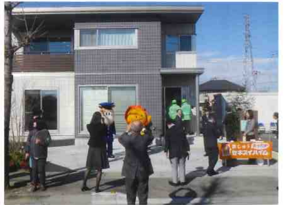
防犯モデル住宅の外観