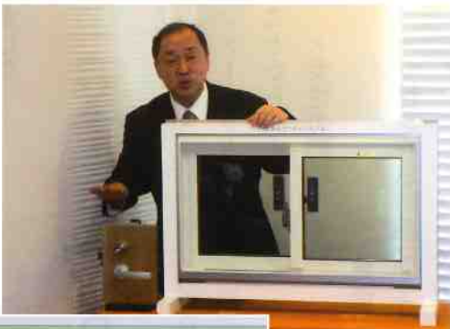
衝撃感知のデモ状況