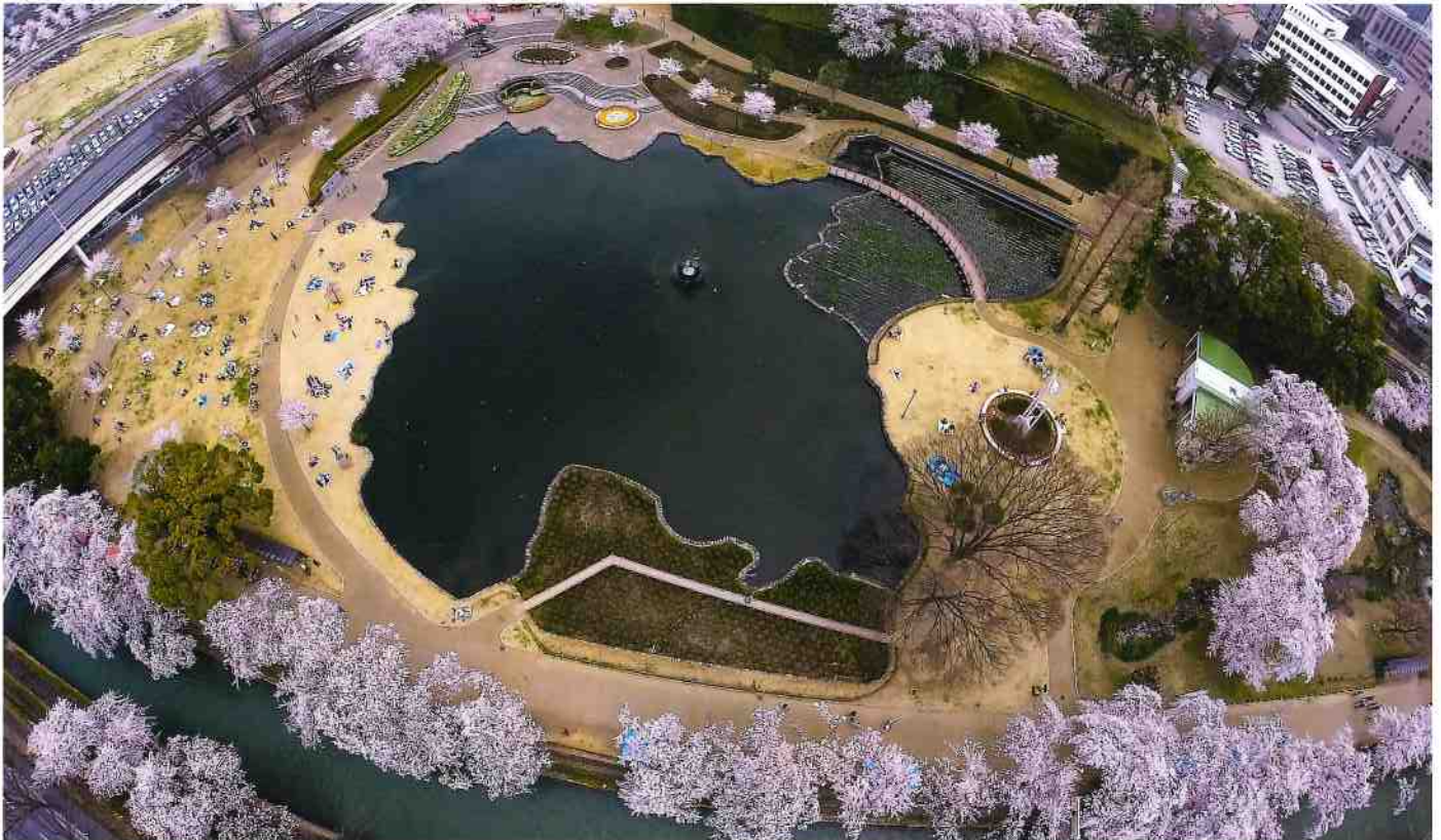
前橋市・幸の池