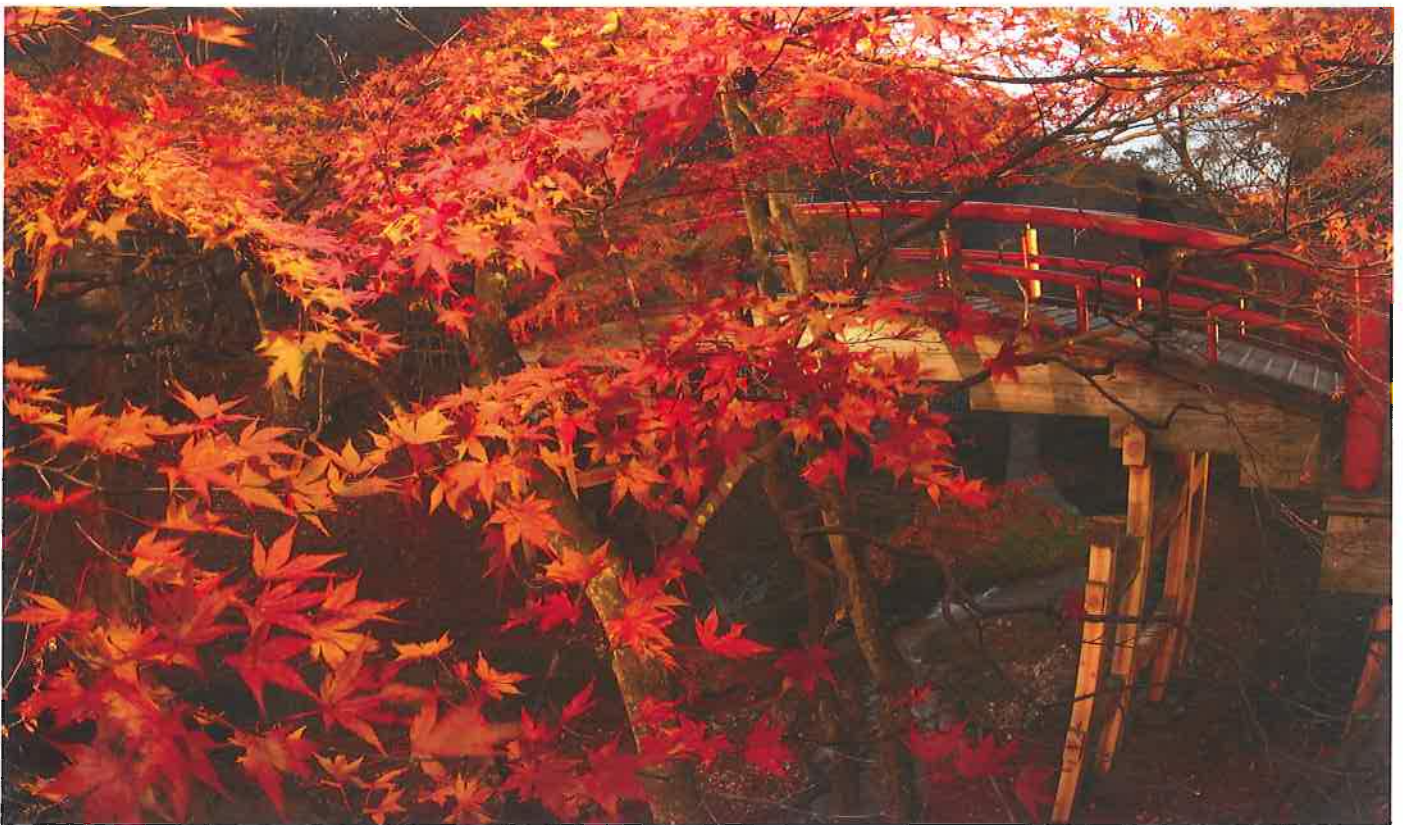
伊香保河鹿橋