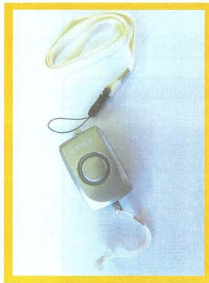
MODEL NO SA-1100

○人声音「助けてー」という女性の声が大音響で鳴り響くブザーです。お値段は一、八百円で