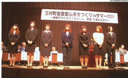
玉村町安全安心まちづくりinサマー2009 ～地域でつくるう！あんしん・安全 たまらまち～