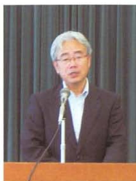
あいさつを述べる 大平修群馬県警察本部長