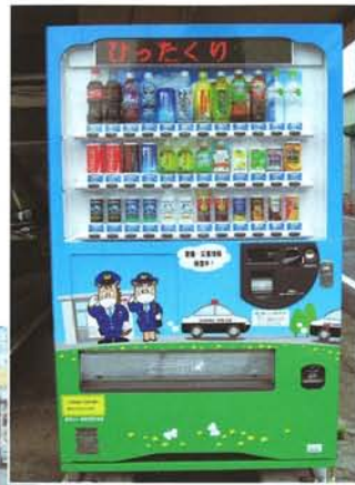
賛助会員のリネイル様前