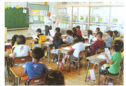
メモ帳をもとに活用している スクールガードリーダー