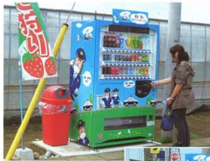
中野いちご園様前

・情報発信機能付自動販売機の設置と活動の推進設置希望のあった三カ所に設置し、運用を開始しました。