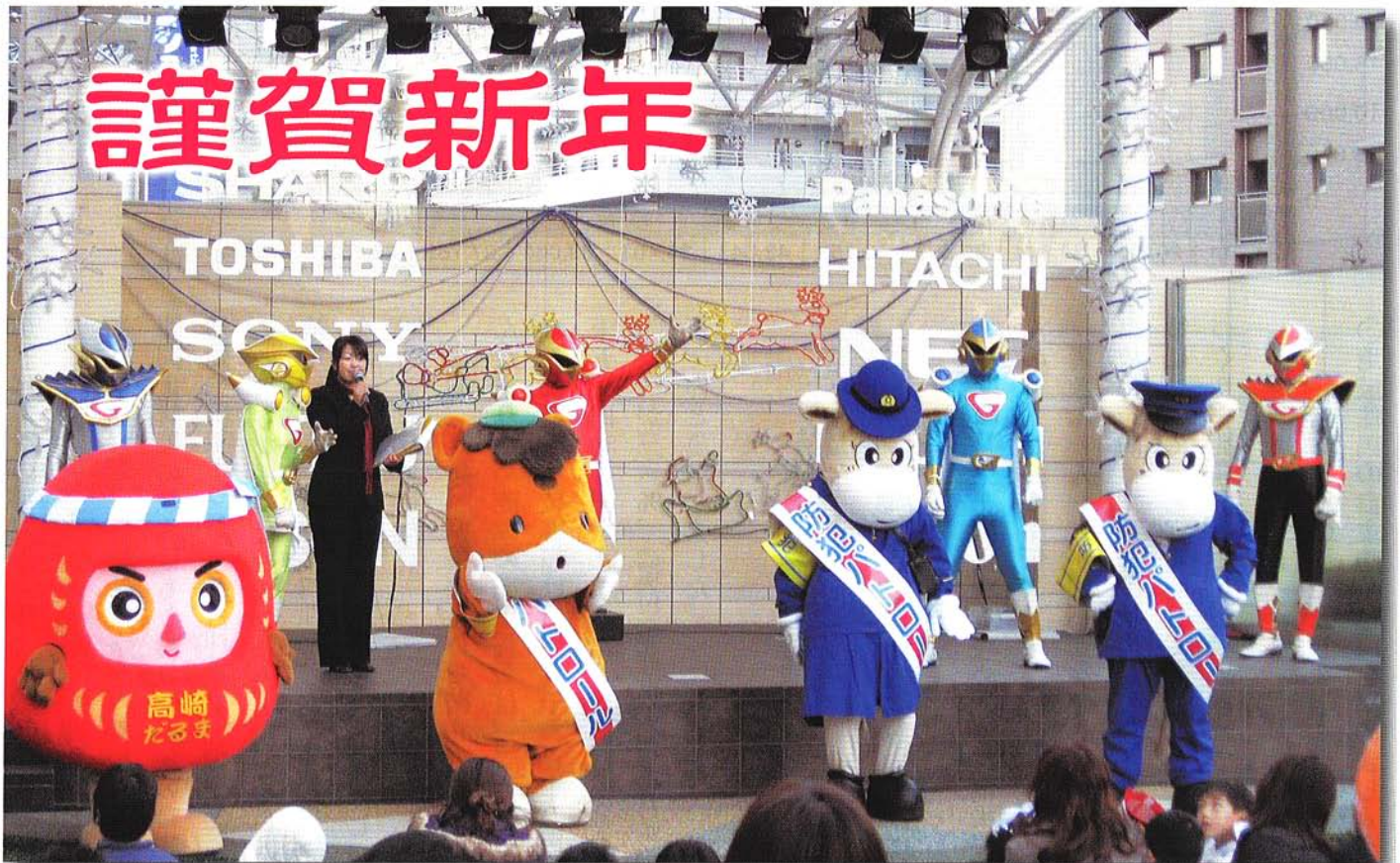
安全・安心まちづくりステージ