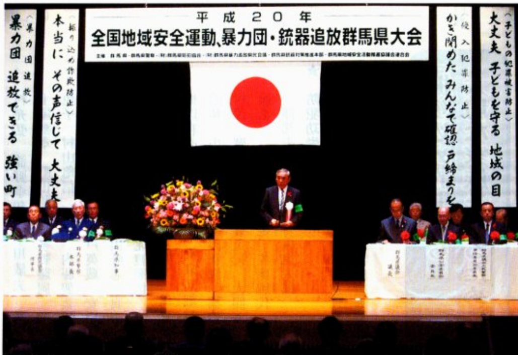
全国地域安全運動、暴力団・銃器追放群馬県大会 (群馬会館)