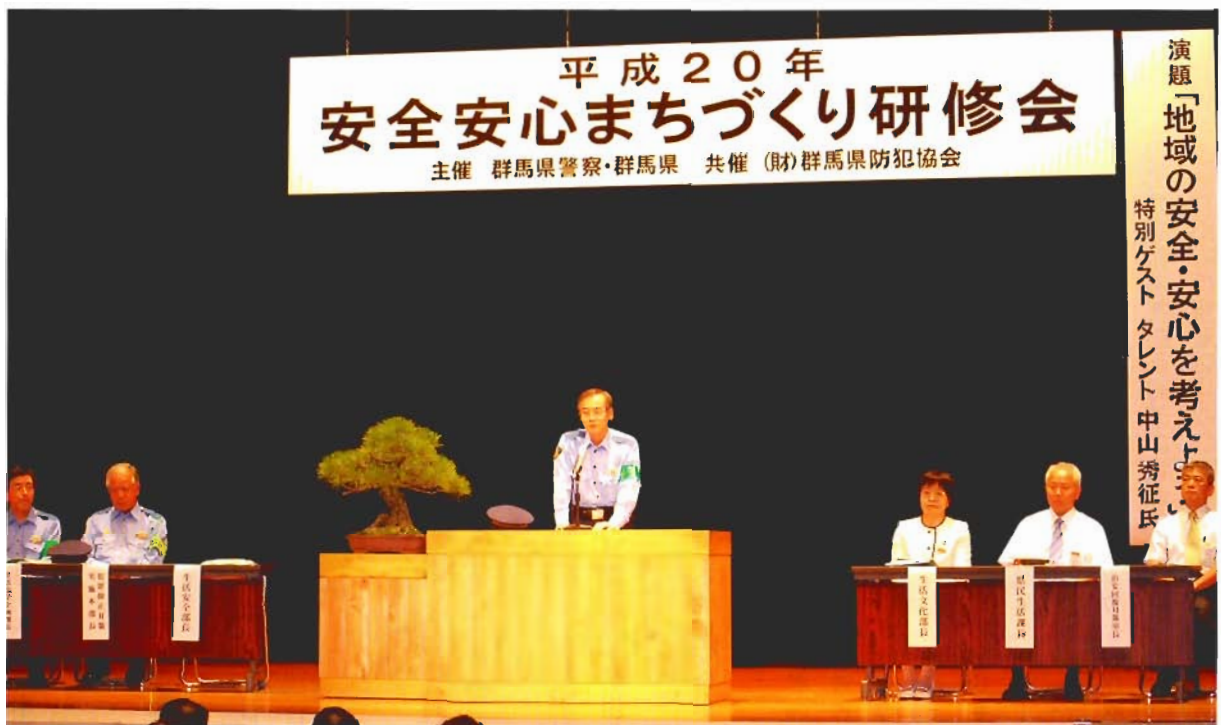
平成20年7月11日 群馬会館